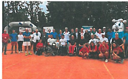
Le premiazioni del doppio