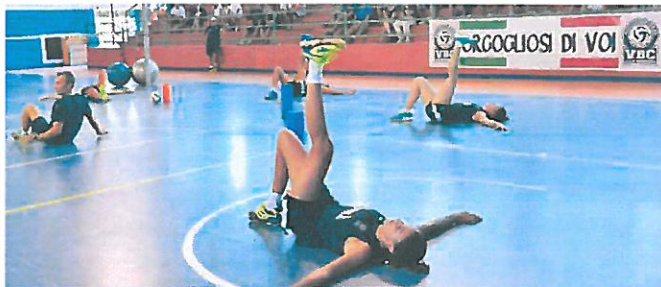
La Pomi in allenamento alla Baslenga