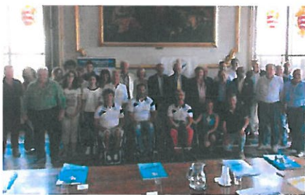
Organizzatori, giocatori e sponsor alla presentazione del torneo

■ CREMONA Su il sipario sulla quarta edizione del torneo di tennis in carrozzina 'Città di Cremona', in programma dal 7 al 10 settembre, sui campi della canottieri Baldesio. Ieri, in sala consulta del municipio di Cremona, organizzatori, giocatori, volontari e sponsor si sono ritrovati per presentare